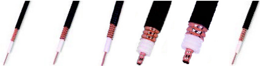
1/4" Hiflex 3/8" Hiflex 1/2" Hiflex 7/8" Hiflex 1-1/4" Hiflex 1/4"